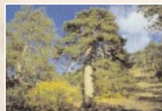
P. Regato - WWF MedPO Archive