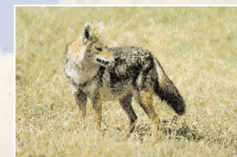
R. Milet - WWF International