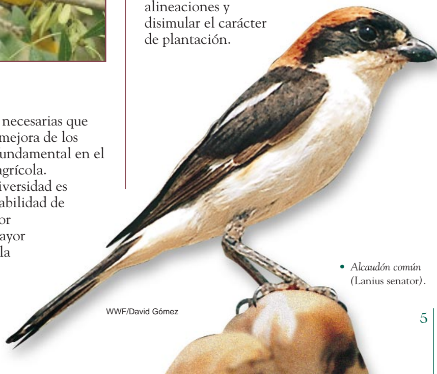
• Alcaudón común ( Lanius senator ).

El nivel óptimo de biodiversidad es aquél que asegura la mayor estabilidad de cada ecosistema, lo que pasa por favorecer la existencia de la mayor cantidad de especies posible y la conservación de pies viejos, muertos o huecos.