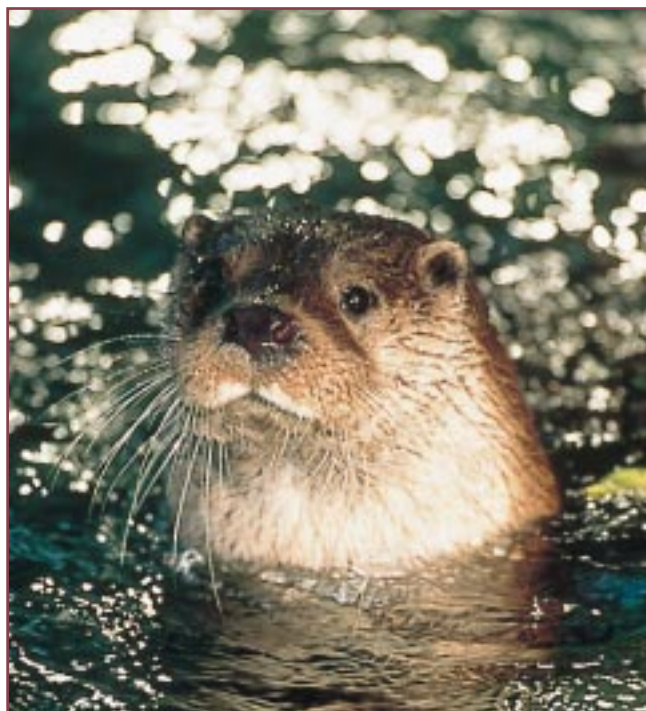
• Nutria ( Lutra lutra ) en el río Ega.

presencia está especialmente ligada al estado de conservación de su hábitat. El Visión europeo es una de las especies en mayor peligro de extinción en Europa. En España, donde es muy poco conocido, existen poblaciones estables en las comunidades autónomas de Navarra, País Vasco y La Rioja. El número de animales adultos quizá no sobrepase los 500 ejemplares.