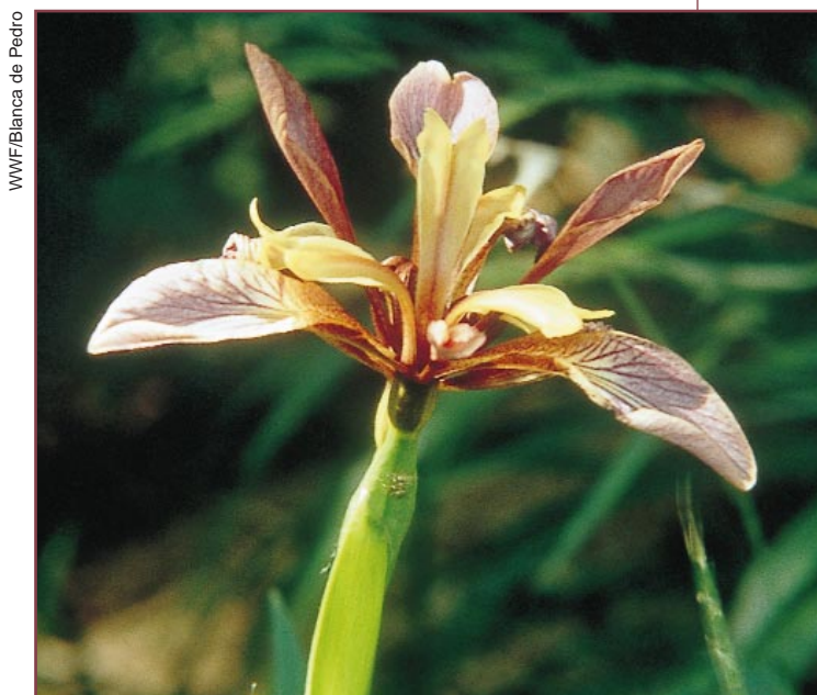
• Iris ( Iris foetidissima ).

La Nutria es un indicador de calidad ambiental, puesto que su