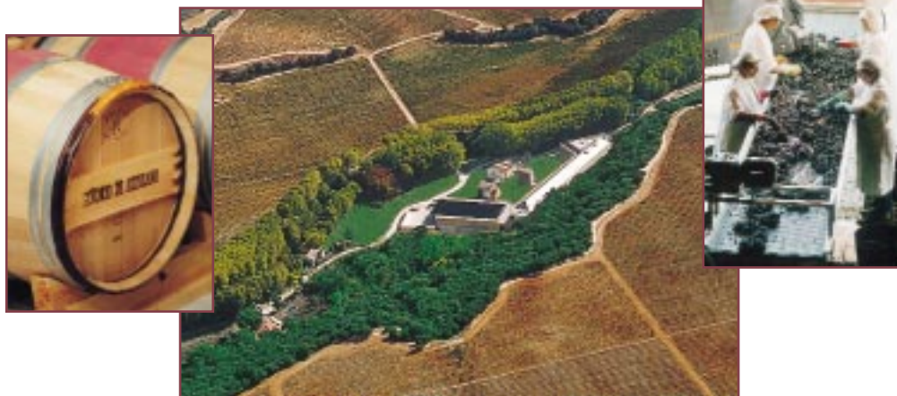
Bodegas Julián Chivite

Bodegas Julián Chivite. C/ Ribera, 34. 31592 Cintruénigo (Navarra). Tel.: 948 811 000. Fax: 948 811 407.