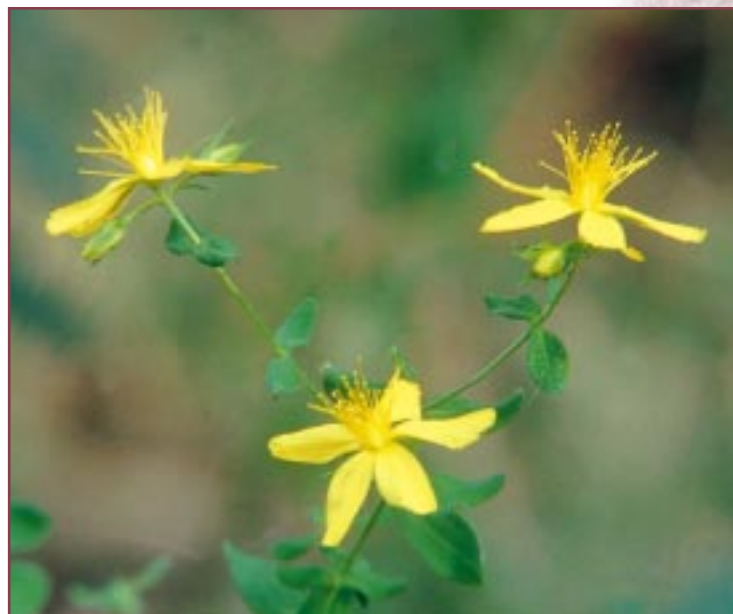
• Hierba de San Juan ( Hypericum perforatum ).

saucos. Este tipo de aliseda aparece dentro de la finca en los márgenes de río Ega, el resto del bosque de ribera se corresponde con una chopera, repoblada, pero con un gran valor paisajístico.