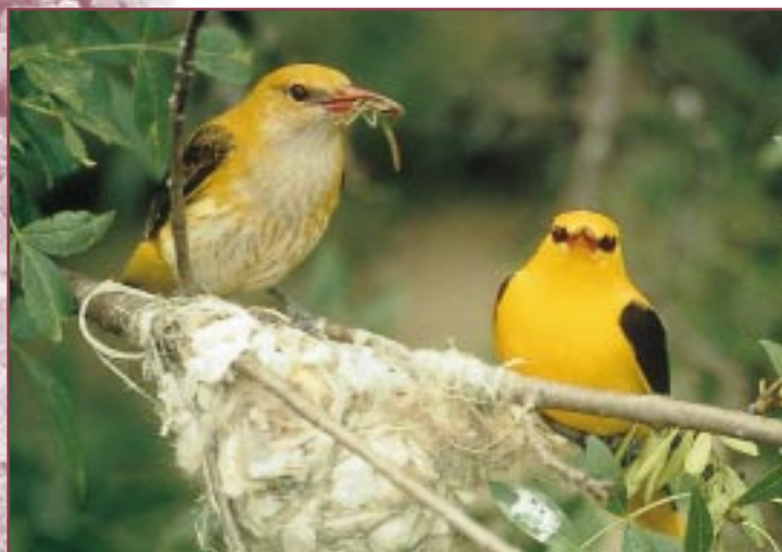
• Pareja de oropéndolas ( Oriolus oriolus ).

En el Plan de Gestión se tienen en cuenta otros aspectos ambientales de la finca que son factores importantes en su conservación como la prevención de la erosión, la prevención de incendios forestales, la conservación del paisaje y el control de plagas. Entre las actuaciones a realizar destacan como las más importantes las repoblaciones forestales, encaminadas en su mayoría a aumentar la diversidad de especies y sólo en algunas zonas para aumentar la densidad. Se realizarán con especies autóctonas y de forma heterogénea, formando bosquetes para evitar alineaciones y disimular el carácter de plantación.