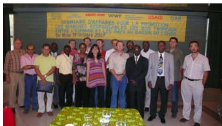
Foto 1. Participantes en la misión comercial organizada por WWF/Adena en la República del Congo el pasado octubre 2007