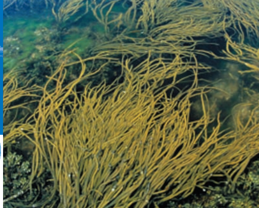
Zona mediotitoral